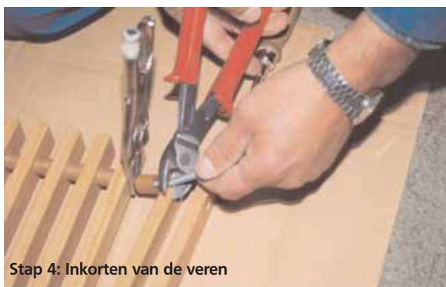
Stap 4: Inkorten van de veren