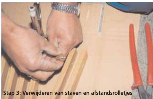
Stap 3: Verwijderen van staven en afstandsrolletjes