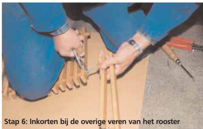
Stap 6: Inkorten bij de overige veren van het rooster