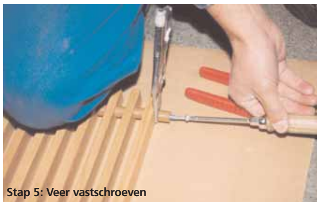
Stap 5: Veer vastschroeven