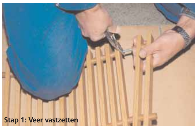
Stap 1: Veer vastzetten

Montagehandleiding · Inkorten of repareren