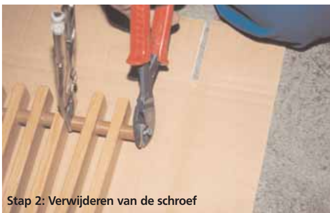
Stap 2: Verwijderen van de schroef